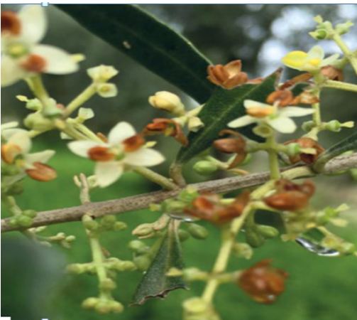
Προσβεβλημένα άνθη / κεραμιδι χρώμα

Θα πρέπει να γίνεται εναλλαγή σκευασμάτων με σκοπό την αποφυγή ανάπτυξης ανθεκτικών πληθυσμών του παθογόνου».