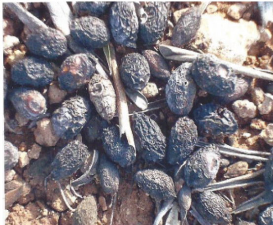
Μωμιοποιημένοι καρποί στο έδαφος